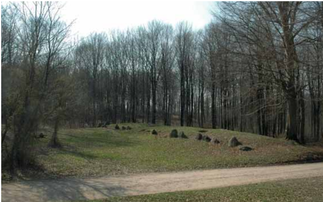
Fortidsminder i skov – langdysse friholdt for træer og opvækst.

iltfattigt miljø, hvor grave som Egtvedpigens kan bevares. Trærodderne kan også udgøre en mere direkte risiko i tilfælde af stormfald, hvor store kræfter er på spil. Dyssekamre er blevet ødelagt på denne måde – både ved at rødderne har trukket store sten op af jorden, og ved at en væltende stamme har ødelagt store dæksten. Derfor skal ikke-stormfaste træer fældes.